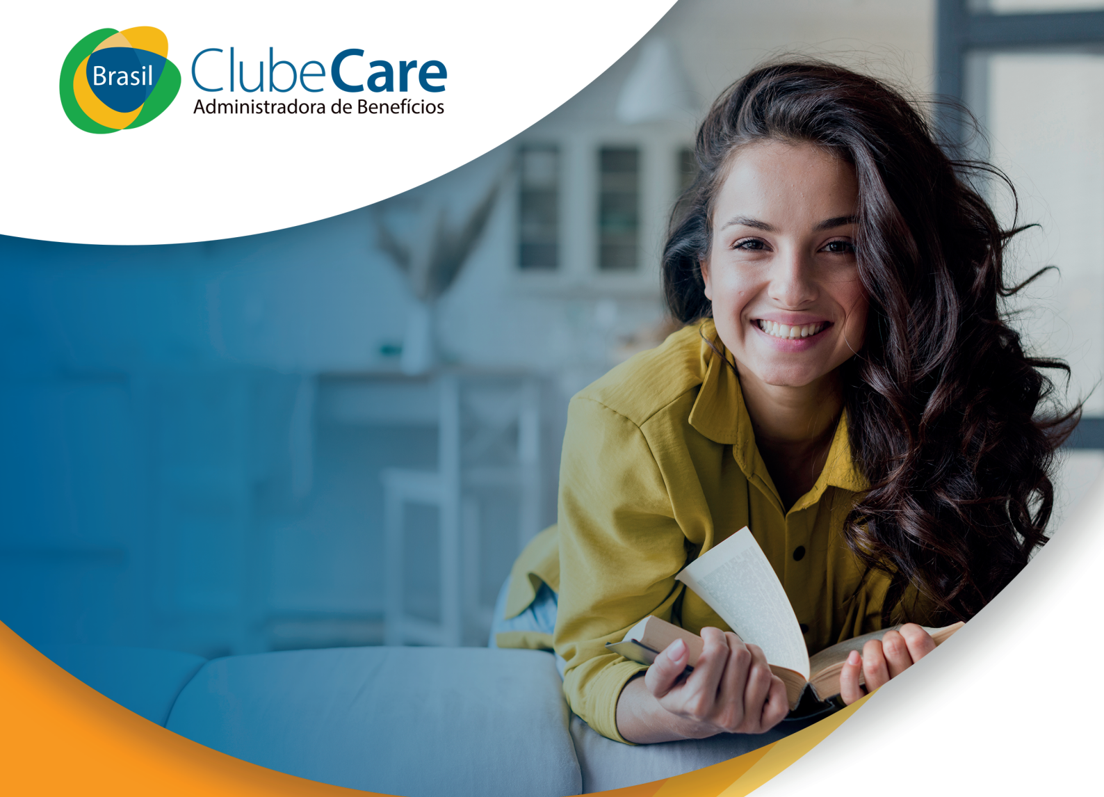
TABELA DE VENDAS PRODUTOS - ADESÃO E PME